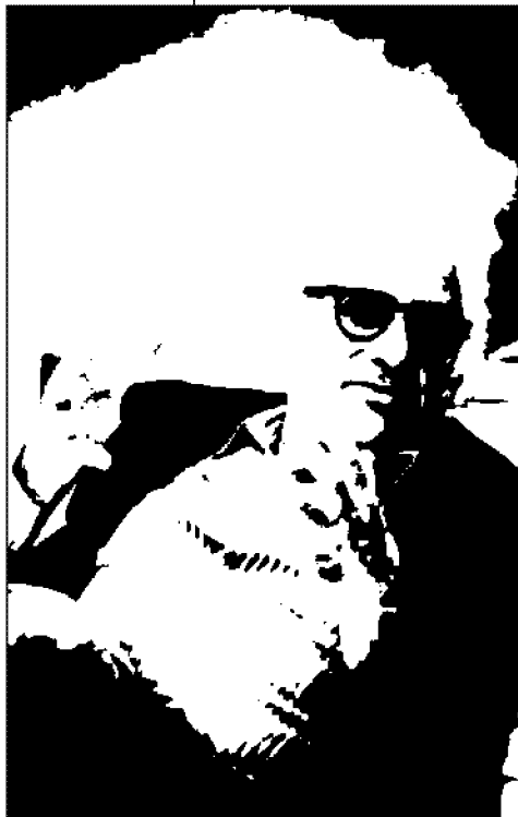
Michael Nyman prima del concerto

Il musicista in vena di confessioni «Quando suono il piano da solo emerge il mio aspetto lirico. Con la band la mia musica è diversa, più energica»