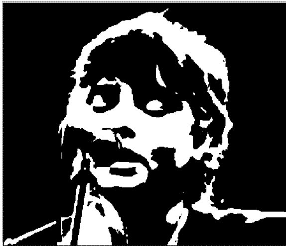
Un intenso primo piano