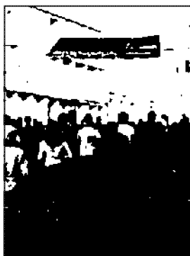
Folla in centro ieri a Fabriano