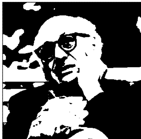
Nyman prima del concerto di Poesis a Fabriano

Un Michael Nyman in vena di confessioni, quasi intimo, quello che si è presentato ieri a Fabriano prima del concerto che ha idealmente concluso l'edizione 2010 di Poesis . Successo anche per Bergonzoni sabato sera: teatro pieno malgrado la Champions