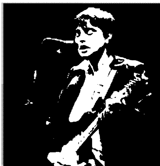
Sinéad O'Connor sul palco di Fabriano