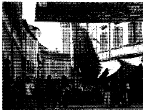
Corso gremito per la giornata di chiusura della kermesse

A fare il resto, dando come sempre un apporto notevole nel rendere il centro più accattivante che mai, sono stati gli operatori commerciali, che hanno tenuto aperto i negozi per tutta la giornata di ieri.