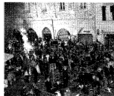
Foto: l'arrivo dei tifosi fino a pochi metri dal palco di 'Poiesis'

rantendo l'ordine pubblico fino a tarda ora in tutto il centro storico pieno di fabrianesi e turisti. Non dovrebbero esserci, dunque, denunce o code giudiziarie sul caso, anche se a breve verranno analizzati i filmati dei momenti più caldi della serata.