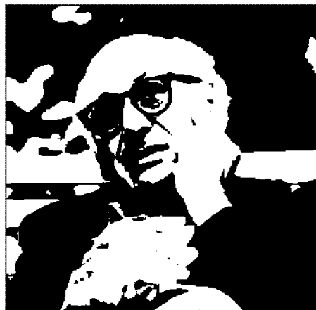
Nyman prima del concerto di Poesis a Fabriano

Un Michael Nyman in vena di confessioni, quasi intimo, quello che si è presentato ieri a Fabriano prima del concerto che ha idealmente concluso l'edizione 2010 di Poesis . Successo anche per Bergonzoni sabato sera: teatro pieno malgrado la Champions