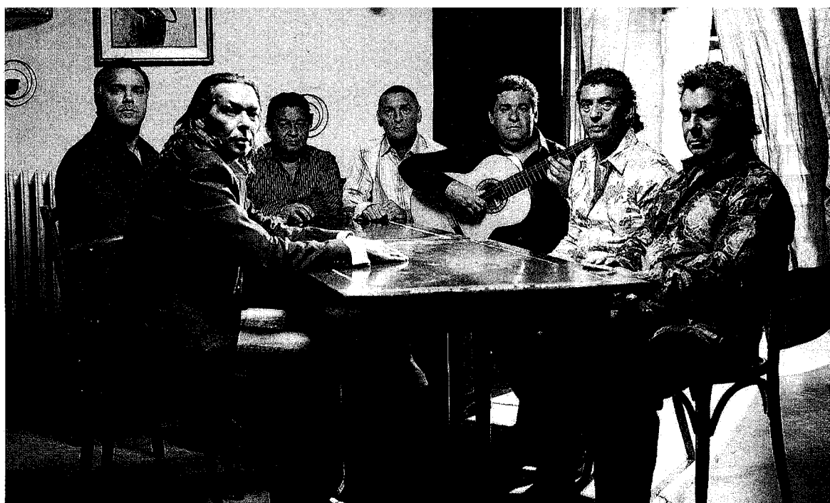
SCATENATI I Gipsy Kings stasera in concerto a Fabriano per l'ultima serata della terza edizione di «Poiesis»