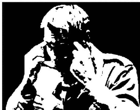
Fabrizio Gifuni durante il suo applauditissimo monologo dedicato a Carlo Emilio Gadda. In platea anche il segretario della Cgil Guglielmo Epifani. Ieri sera a Poiesis si è invece esibito Alessandro Bergonzoni

A PLAUSI scroscianti, venerdì sera in un Teatro Gentile gremito, per la "performance" di Fabrizio Gifuni , protagonista del monologo L'ingegner Gadda va alla guerra . Un'ora e mezza di assolo a ritmo incalzante, davvero a perdifiato, durante l'attore romano ha rivissuto, attraverso la vita di Carlo Emilio Gadda, gli errori e gli orrori della Prima Guerra Mondiale e poi l'affermarsi della farsa fascista. Tra i presenti, in teatro, anche il sindacalista Guglielmo Epifani (segretario della CGIL) ed il filosofo Massimo Cacciari (che aveva tenuto ai Giardini del Poio la sua "lectio magistralis" sul concetto di Fare). Ieri sera, invece, sulle tavole del Gentile si è esibito il poliedrico bolognese Alessandro Bergonzoni , presente a Poiesis nella duplice veste di attore comico e di artista (la sua "personale" è allestita al Buon Gesù).