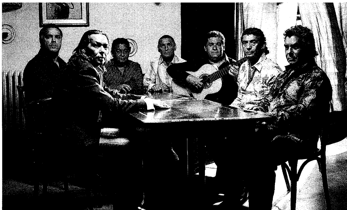
SCATENATI I Gipsy Kings stasera in concerto a Fabriano per l'ultima serata della terza edizione di «Poiesis»