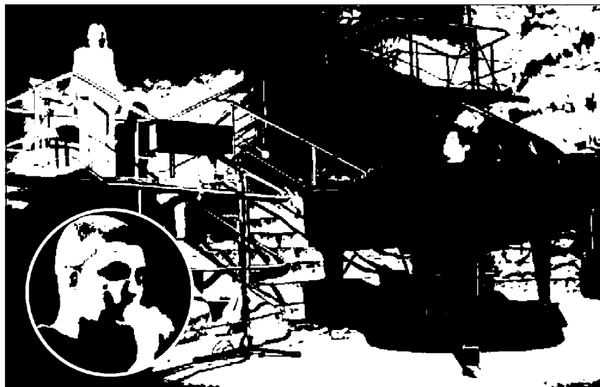
Cocco, Curti e Maccarone alle pagg. 49 e 50