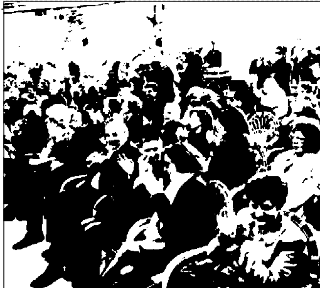
La folla all'inaugurazione di Poiesis