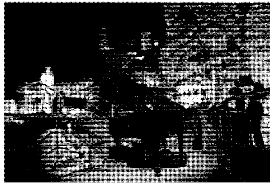
L'anteprima di Poiesis l'altra sera alle Grotte di Frasassi