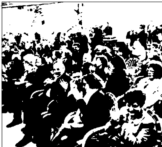
La folla all'inaugurazione di Poiesis