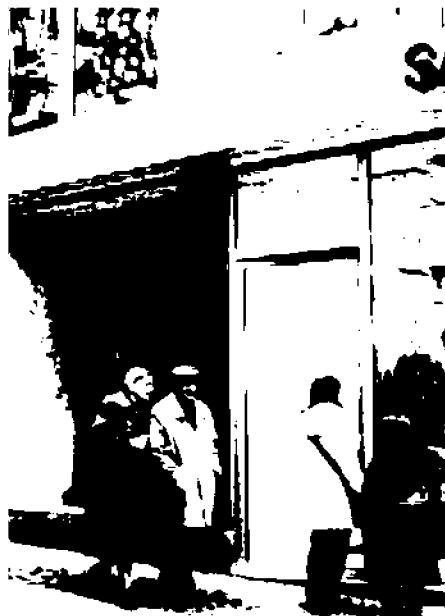
Il commercio del centro di Fabriano dà segnali di vitalità