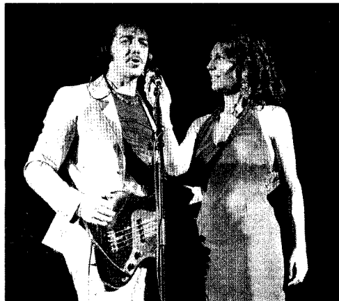
Max Gazzè e Francesca Merloni nell'edizione dello scorso anno di Poesis. Torna la rassegna culturale

Madre Terra è il tema della terza edizione di Poesis, il festival ideato e diretto da Francesca Merloni, che da venerdì a domenica trasformerà Fabriano, città del fare e del creare, in un palcoscenico dove poesia, musica, arti figurative, teatro e cinema si intrecceranno in un percorso che non imporrà tesi ma offrirà molteplici punti di vista. L'apertura è riservata al filosofo Massimo Cacciari, cui seguirà l'esecuzione da parte dell'Orchestra filarmonica Marchigiana, diretta da Manlio Benzi. Nei Giardini del Poio spazio alla poesia con incontri con personaggi del calibro di Maria Grazia Calandrone, Pier Luigi Cappello, Giuseppe Conte, Mariangela Gualtieri, Paolo Lisi, Davide Rondoni, Tiziana Cera Rosco e Valentino Zeichen. Fra la molteplicità degli "Appuntamenti musicali" in programma il concerto di Sinéad O'Connor. Altra figura internazionale è Michael Nyman, uno dei massimi compositori viventi. In cartellone anche i concerti dei Tazenda e del gruppo di musica popolare marchigiano La Macina. Per la sezione "Spettacolo" in arrivo Fabrizio Gifuni, Alessandro Bergonzoni, Marcorè e Buy. Da non perdere sarà la programmazione cinematografica alla sala Montini dove si svolgerà una no-stop di pellicole selezionate da Tatti Sanguineti.