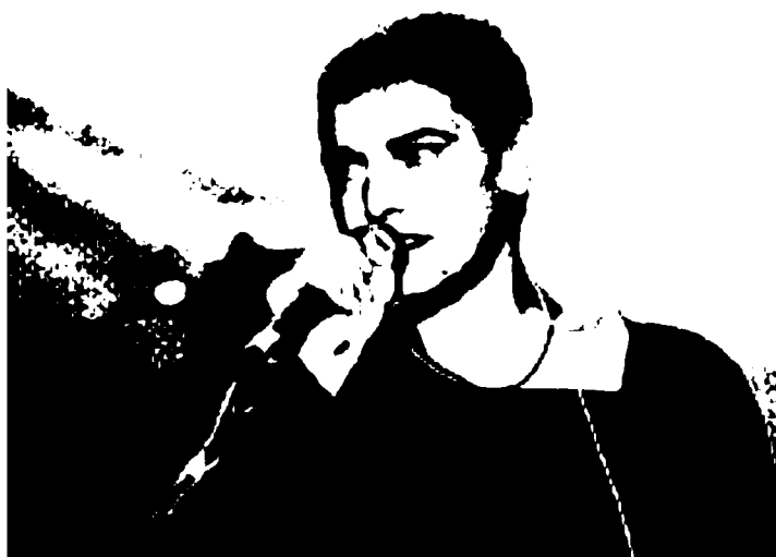
SUL PALCO Sinead O'Connor sarà tra gli ospiti di «Poiesis»